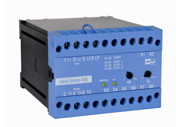
Motorstart-Bremskombination VBMS ...