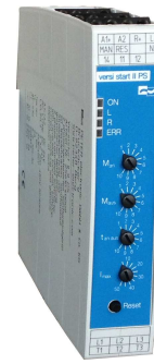
Sanftanlauf-Wendestarter VersiStart II 9 PS CE